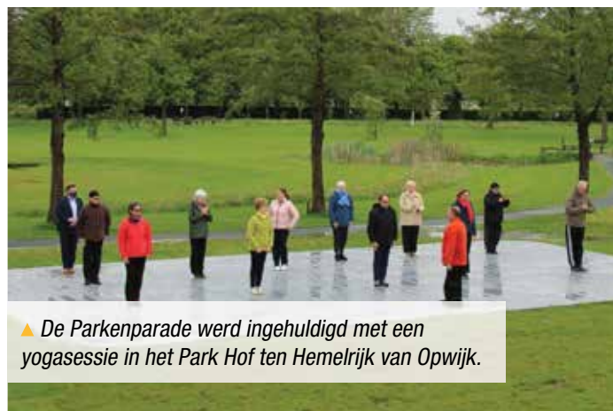
▲ De Parkenparade werd ingehuldigd met een yogasessie in het Park Hof ten Hemelrijk van Opwijk.

Toerisme Vlaams-Brabant lanceerde in mei de nieuwe campagne ‘Parkenparade’. Daarmee wil ze het groene karakter van de parken en tuinen van de Groene Gordel op een innovatieve manier in de schijnwerper plaatsen.